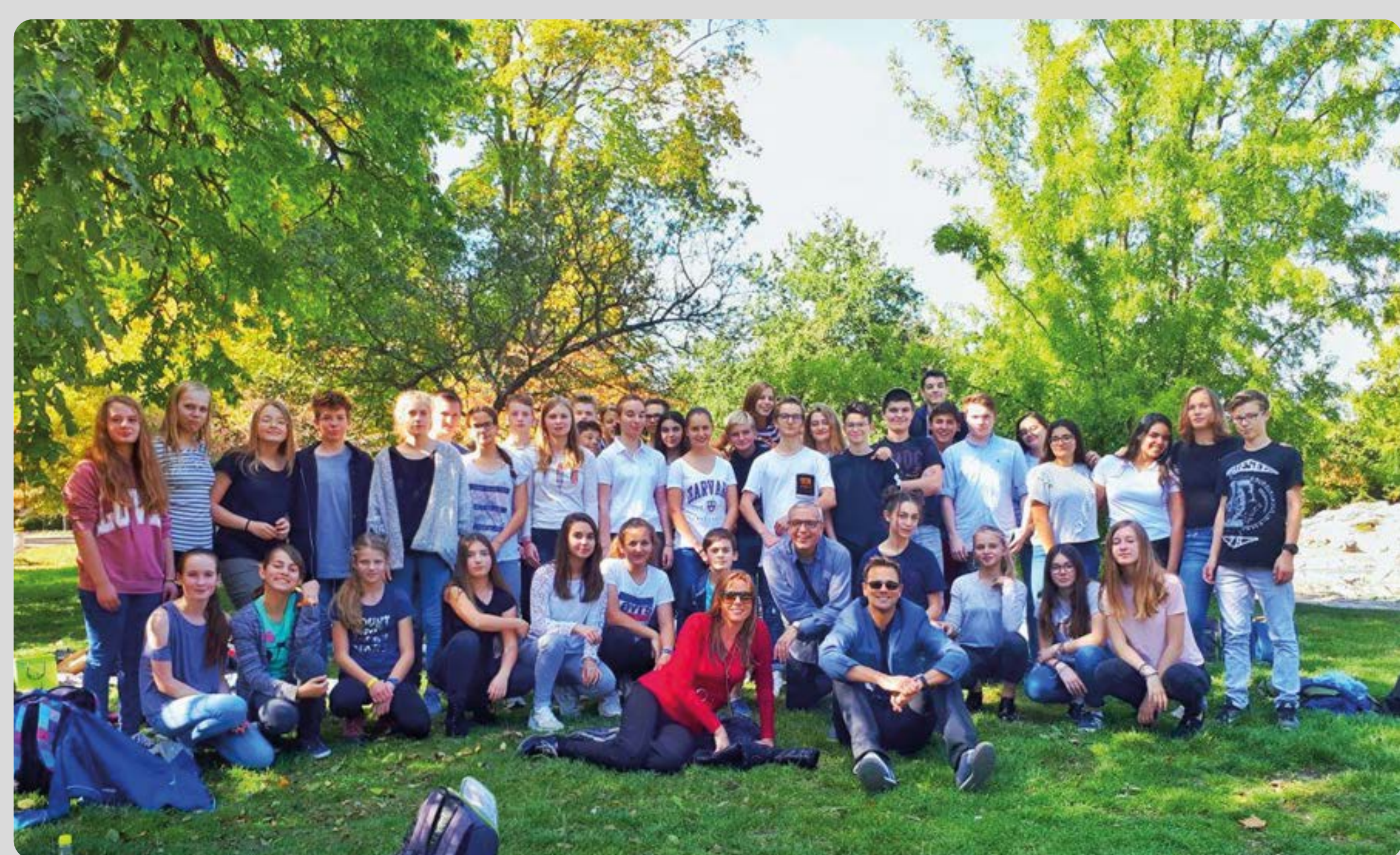
Schulaustausch Albert-Einstein-Gymnasium – Collège-Lycée Saint-Paul (Roanne - bei Lyon)

... Ich interessiere mich für Frankreich und andere französischsprachige Länder.